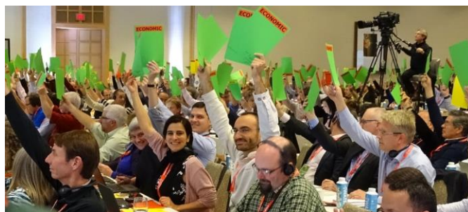
Експерти на NEPCon гласуващи в Общото събрание на FSC – 2017 г.

Пример за това е участието ни в развитието на системи за сертифициране като Forest Stewardship Council™ (FSC™) и Sustainable Biomass Partnership (SBP) и работим по различни други мрежи като, ISEAL and Sustainable Agriculture Network (SAN). Освен това, допринасяме за ключови глобални дискусии чрез участие в конференции и срещи по целия свят.